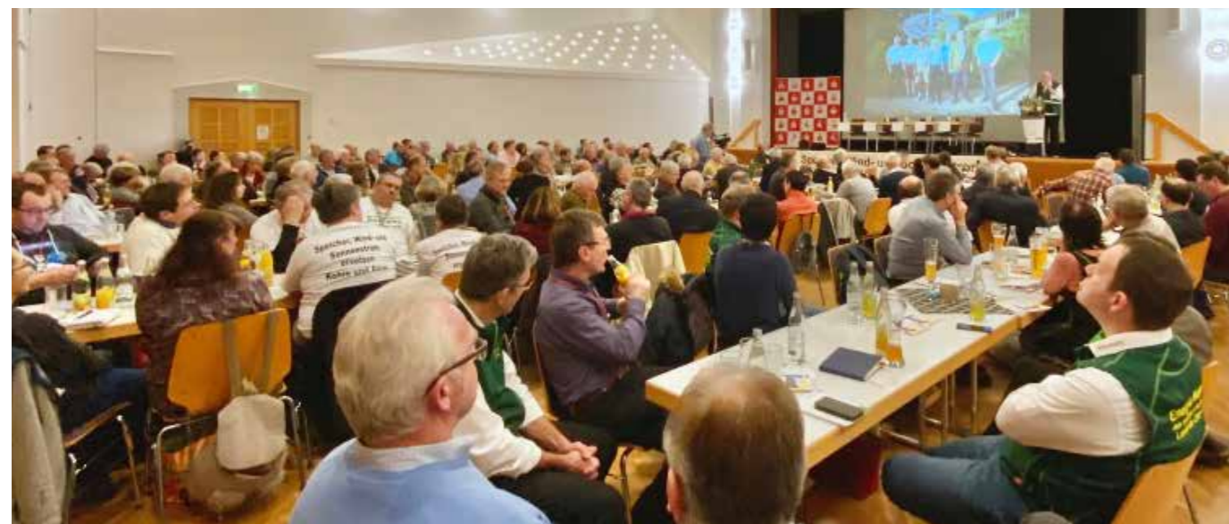
27. ABSI-Jahrestagung 2020 in Roding