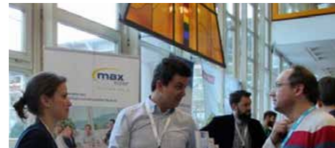
26. ABSI-Jahrestagung 2019 in Rosenheim

Am 24. und 25. Februar 2023 findet als Präsenzveranstaltung der ABSI-Kongress statt. Der Titel „Mit Sonne, Wind & Co. – gemeinsam 100 % unabhängig“ zieht sich als Leitthema durch die Veranstaltung.