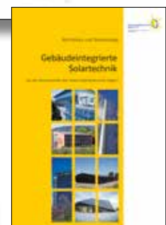
Die eingereichten Projekte der vorangegangenen Wettbewerbe wurden zudem in einem Buch, Broschüren, einem Kalender und mit Vorträgen der Öffentlichkeit präsentiert.