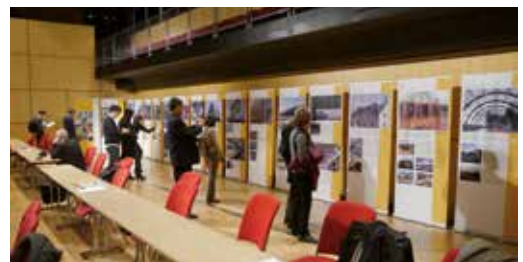
Die Wanderausstellung tourt erfolgreich auf Messen, Konferenzen und sonstigen thematisch geeigneten Veranstaltungen.