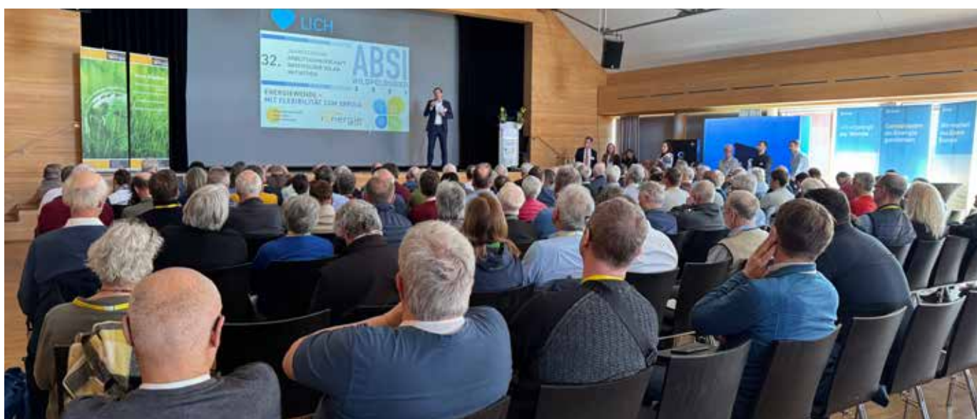
32. ABSI-Jahrestagung 2025 in Wildpoldsried